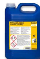
SUMA GEL KLOR D34