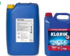
TITAN HYPO OG KLORIN