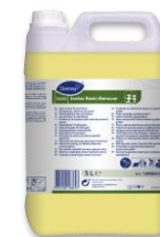
TASKI RESIN REMOVER