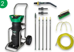
UNGER HYDRO POWER