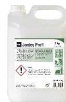
TASKI JONTEC PROFI